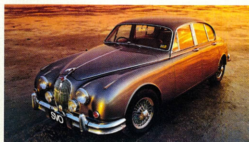
La berline Mark 2 affiche une cote encore assez faible. Certains exemplaires s'échangent à moins de 30 000 €.